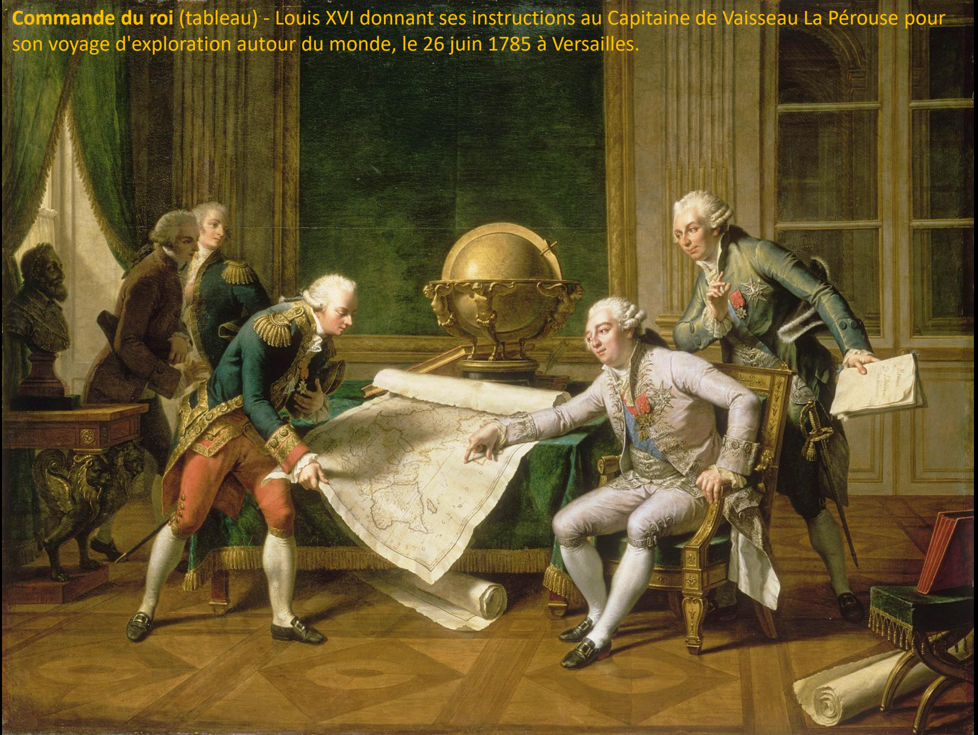
Commande du roi (tableau) - Louis XVI donnant ses instructions au Capitaine de Vaisseau La Pérouse pour son voyage d'exploration autour du monde, le 26 juin 1785 à Versailles.